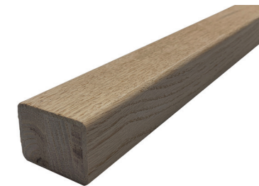
SP566 Main courante 1-1/2" x 2-1/4" x 8', 10', 12' Disponibles en grade peinture, érable et chêne