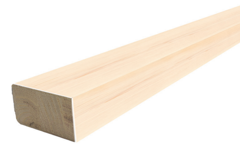
SP566 Main courante 1-1/2" x 2-1/4" x 8', 10', 12' Disponible en grade peinture, érable et chêne